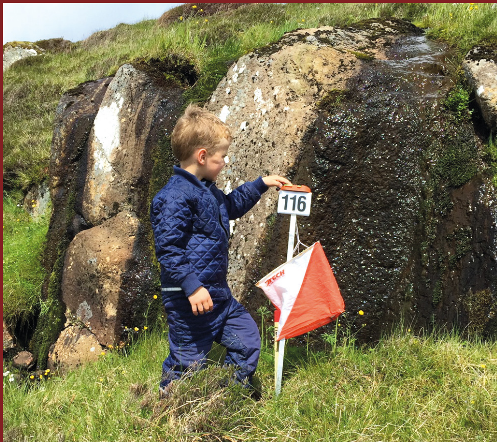
De yngre deltagere var også med ude på banerne

En stor del af deltagerne brugte vores første tur som en lejlighed til fælles familieoplevelser. Yngste deltager var 2 år, imens den mest rutinerede havde rundet 85 år. Også denne gang har vi fokus på, at alle skal kunne deltage og få en oplevelse ud af det – uanset om man er orienteringsløber eller blot med for at få en "once in a lifetime experience". De enkelte løb er med baner for både erfarne løbere og begyndere. Ved fjeldvandringerne er der valgt ruter velegnet for børn, men her kræver deltagelse en grundlæggende god fysisk form og mobilitet. På toppen af Slættaratindur skal man være særligt agtpågivende, da der visse steder er meget stejlt.