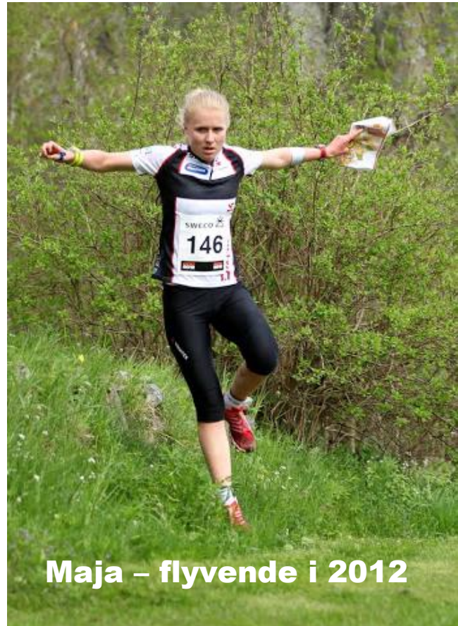
Maja – flyvende i 2012

Gåskærgade 38-44 6100 Haderslev Tlf. 73 52 06 00