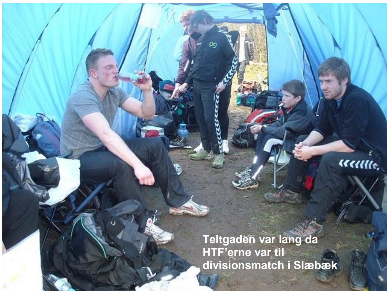
Teltgaden var lang da HTF'erne var til divisionsmatch i Slæbæk