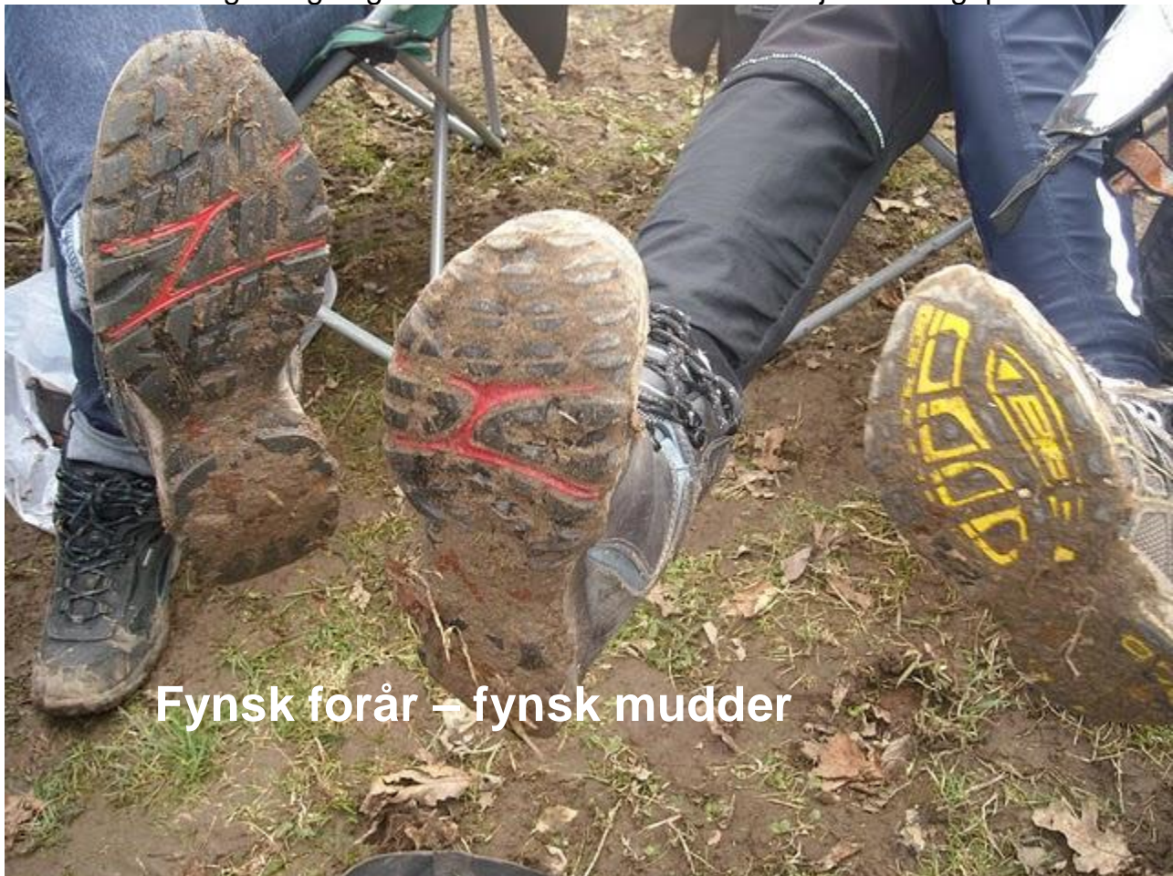
Fynsk forår – fynsk mudder

Det er der heldigvis også gode kræfter i klubben som arbejder kraftigt på.