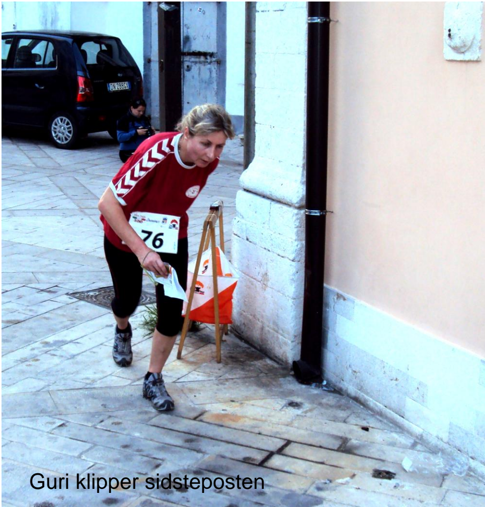
Guri klipper sidsteposten

En flot afslutning på en vellykket uge i bella Italia.