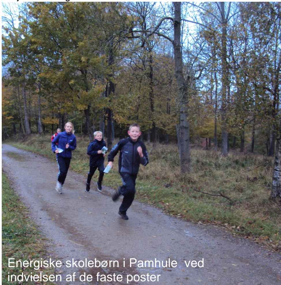
Energiske skolebørn i Pamhule ved indvielsen af de faste poster

Hvordan bliver det så brugt?? Ja, vi må konstatere, at det bliver anvendt rigtig meget, hvor vi ofte skal fylde kortkasserne op - det var ellers meningen, at disse skulle være til låns, men folk "glemmer", at lægge dem tilbage igen - så hvis dette "misbrug" fortsætter må vi overveje, at de selv skal printe kortet fra vores hjemmeside, men så er det jo ikke længere så SYNLIGT!