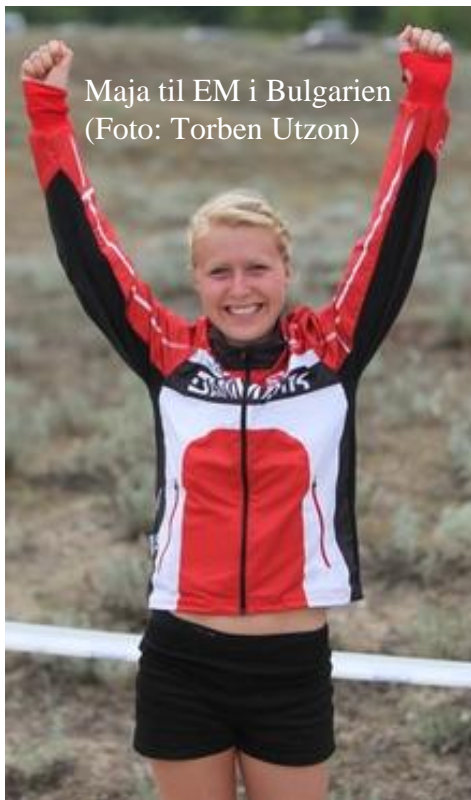
Maja til EM i Bulgarien