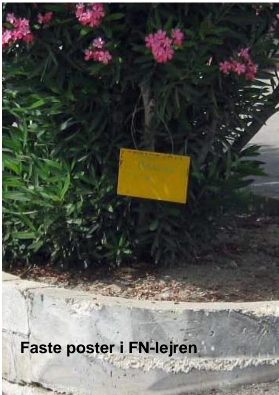
Faste poster i FN-lejren

Da jeg afleverede kortet med kontrolbogstaver til banelæggeren fik jeg snakket lidt med ham om O-løb her i lejren, dagens løb var i den del som er mest flad og mest bebygget, derfor var det nærmest byløb. Men der er en stor del som er meget naturligt med store kurver, slugter og bevoksning, der lever sjakaler her men de ses kun om natten, hvor man også kan høre dem. Vi har nogle hunde i lejren der jager disse sjakaler væk.