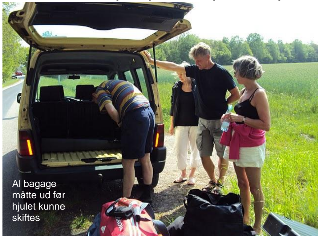
Al bagage måtte ud før hjulet kunne skiftes