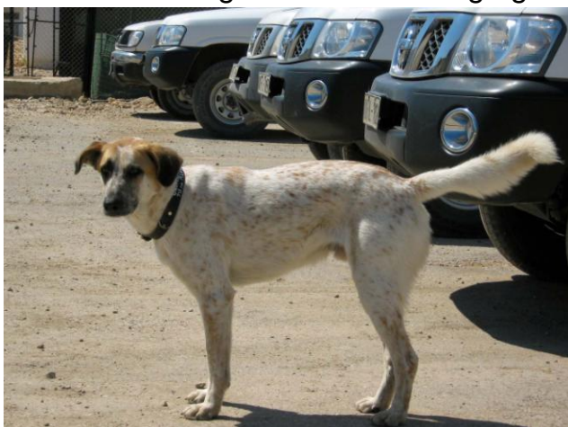
Hund til afskrækkelse af sjakaler

Da der er et meget stenet underlag og en meget robust vegetation, må det påregnes at det vil blive meget hårdt at løbe i dette terræn, så hvis der bliver lavet et O-løb i denne del af lejren, bliver der nok mest sat poster ved veje og bygninger, så kan sjakalerne også være i fred inde i buskadset.