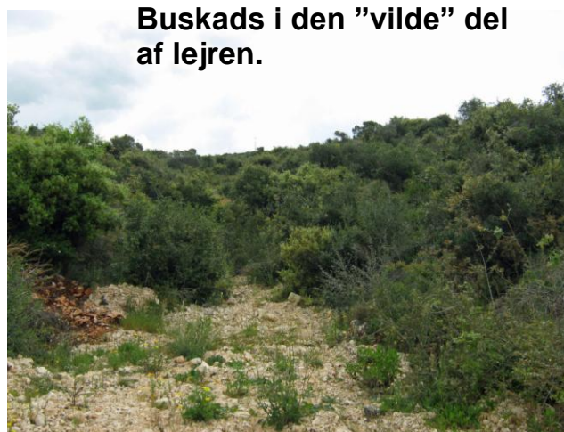
Buskads i den "vilde" del af lejren.

mere "naturlige" terræn. Han havde haft det i tankerne, men kortmaterialet / luffotos' af området er for dårligt derfor blev området ikke brugt. Men han gav mig ret i at det ville give nogle rigtige gode udfordringer da der er mange stigninger, han ville gerne lave noget der når han fremskaffer bedre kort / fotos'.