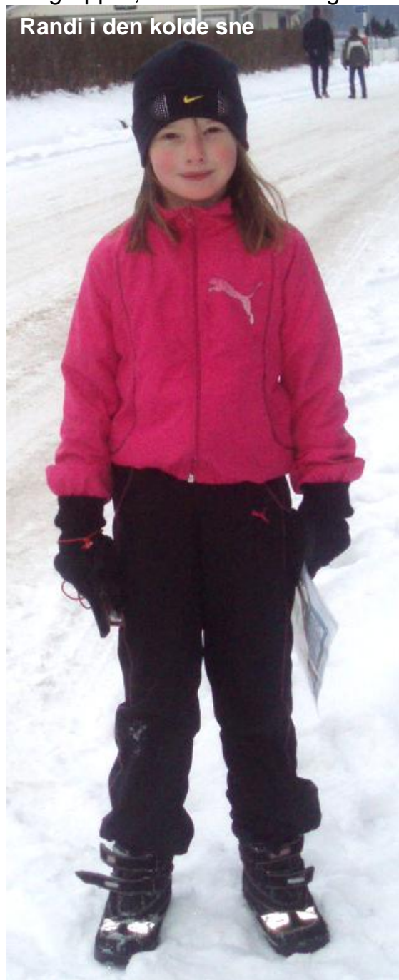
Randi i den kolde sne

Det har været en sjov weekend og jeg glæder mig allerede til næste U1 kursus den 6-7 marts hvor vi også skal ud at løbe et rigtigt natløb.