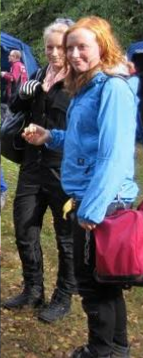
Klubtur til DM for hold i Jægersborg Hegn