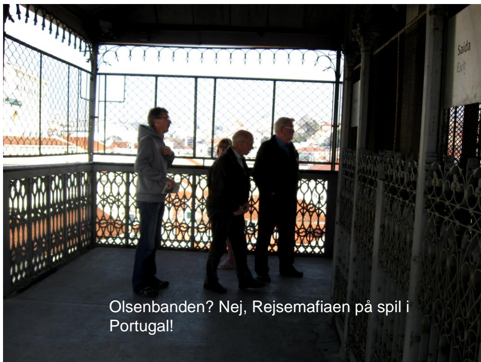
Olsenbanden? Nej, Rejsemafiaen på spil i Portugal!

Gåskærgade 38-44 6100 Haderslev Tlf. 73 52 06 00