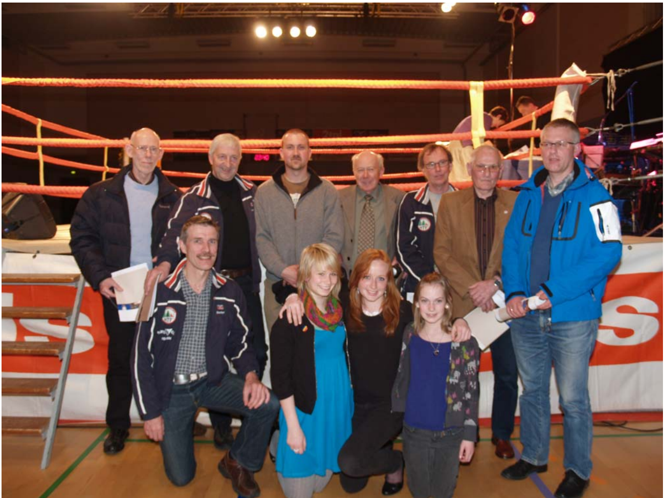
De be'est fra Ha'sle, Vojns å Gram i 2006 & 2007 Af Jørgen Thingvad.

Fredag 11.april 2008 var idrætsudøvere fra Haderslev Kommune, der havde vundet mesterskaber under Dansk Idrætsforbund (DIF) i 2006 & 2007, inviteret til stor fest i Haderslev Idrætscenter. Desuden var jubilerende idrætsledere med 10 og op til 50 års jubilæum i idrætsforeninger i kommunen, inviteret med.