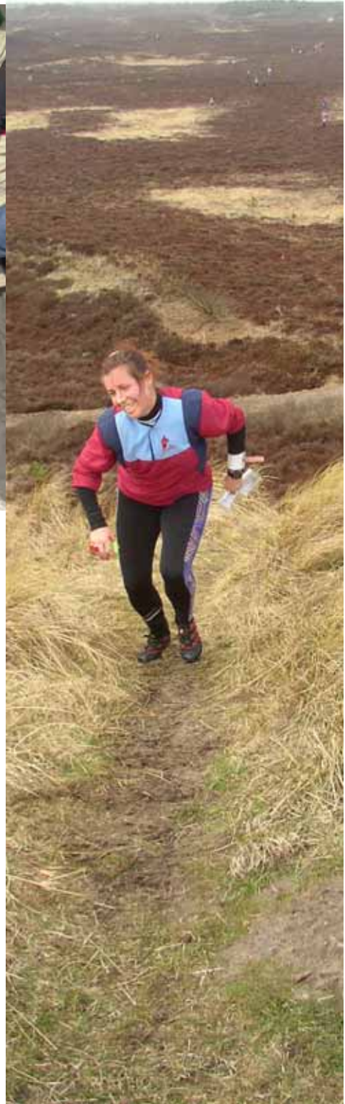
Flere Billeder fra påsken