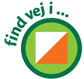
Varbergparken findveji 2018